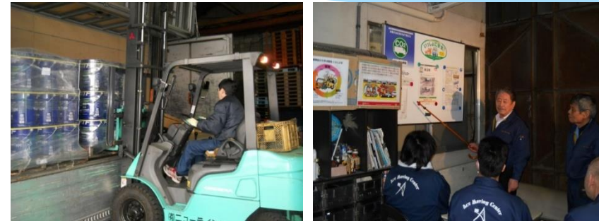
認定証(上)、作業や社内研修の様子(下)