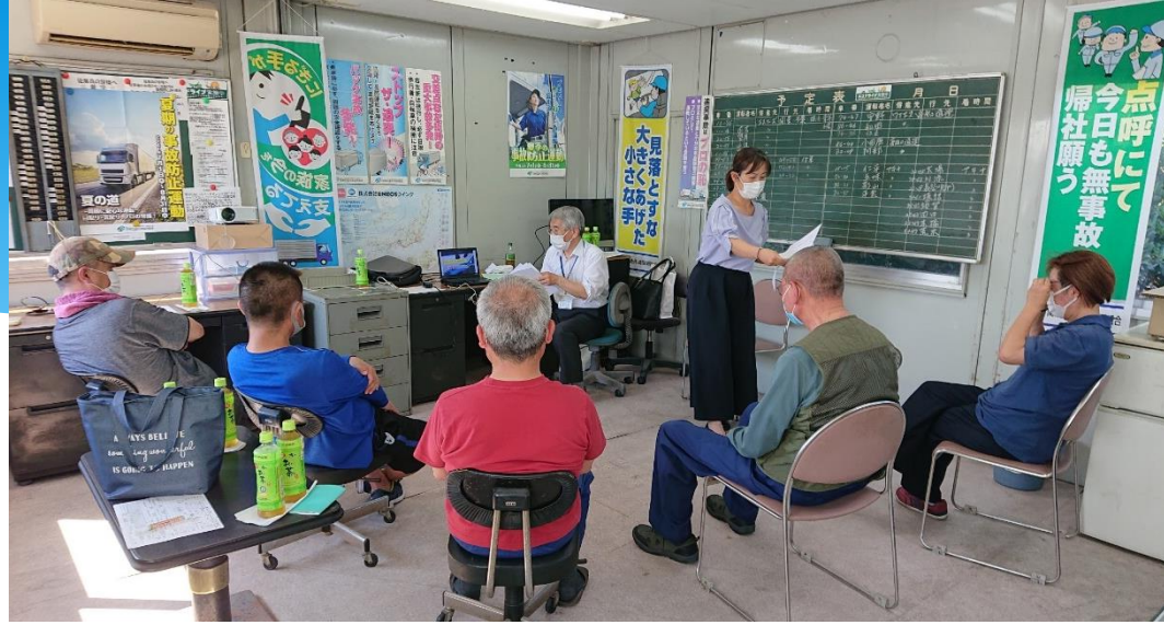
小集団ミーティングの様子